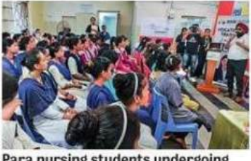
Para nursing students undergoing training at the Trombay centre